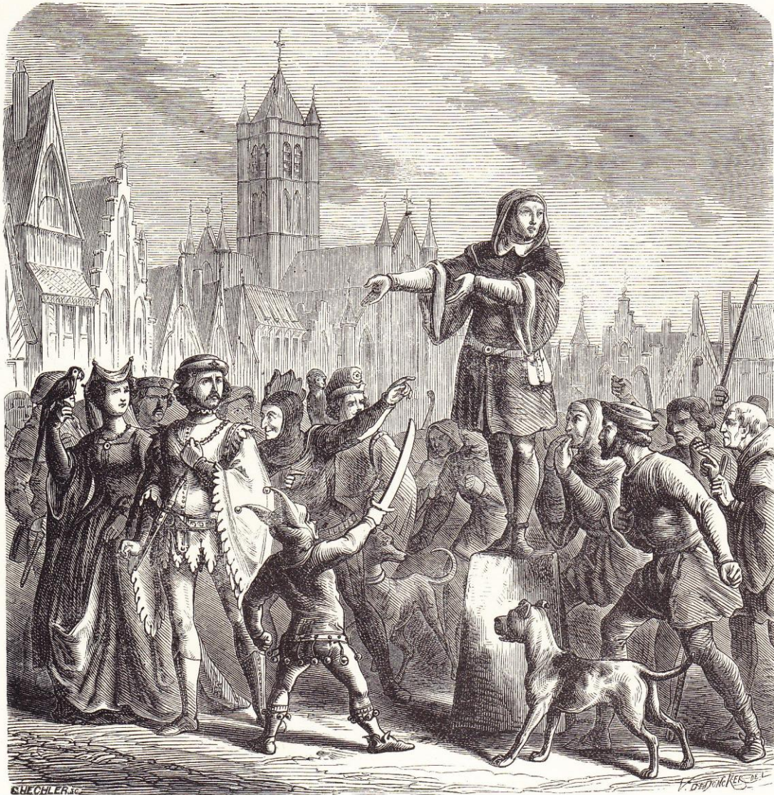
EENE PARTIJ ONTEVREDENEN TE GENT.

de Gentenaars te morren (1377). Zij onderwierpen zich nochtans aan de betaling eener nieuwe belasting; maar eene partij van ontevreden die spoedig aangroeide, ontstond onder hen (1379). De witte-kappen (zoo noemden zij zich) namen elke gelegenheid waar om onlusten te verwek-